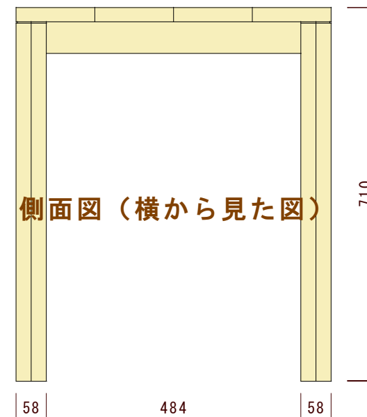
側面図（横から見た図）